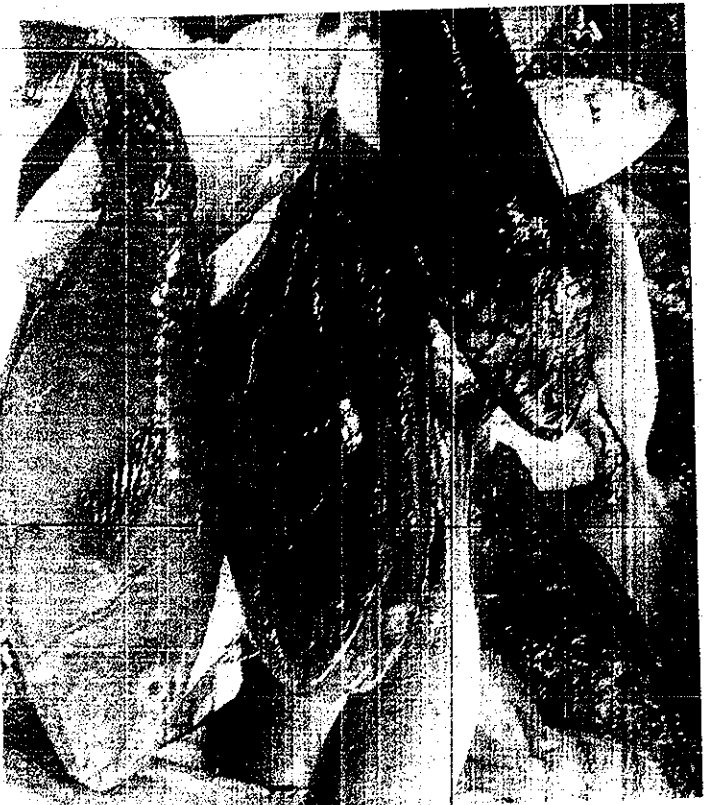
▶ ห้ามขาย...ภาพปลานกแก้ว ปลา สวยงามแห่งท้องทะเลไทย อุวฯ ขาย เกลื่อนในตลาดสดมหาชัยจนแฮร์รี่ใน โลกออนไลน์ถล่ม เริ่ม กล้วยตากปาร์ตี้ กระบี่ ประกาศขายบางซวยอย่างเด็ดขาด ชี้รับเอาสารพิษตกค้างในกล้วยตาก